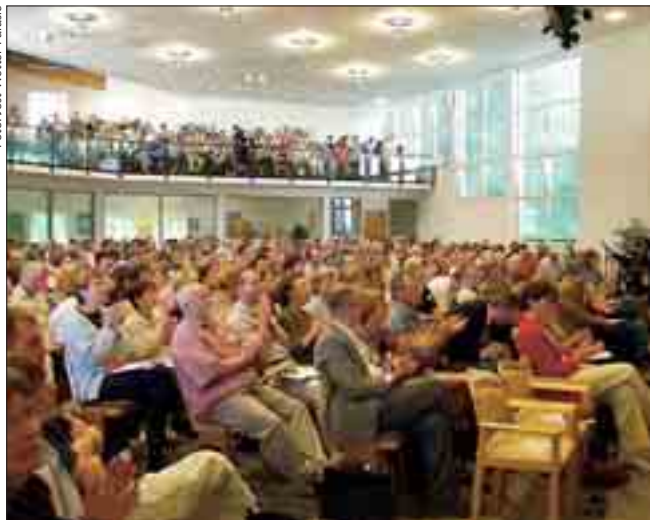
APS-Kongress im Mai 2003 in Marburg

erreichen.“ Dazu organisiert die Akademie Seminare, Tagungen und Kongresse, die sowohl als Diskussionsforen als auch als Weiterbildungsangebote konzipiert werden. Ferner will die Akademie wissenschaftliche Forschungsprojekte in ihrem Bereich fördern.